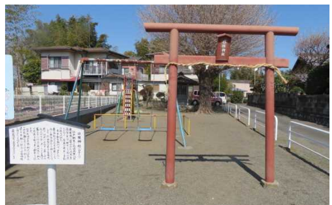
上依知六九番地付近