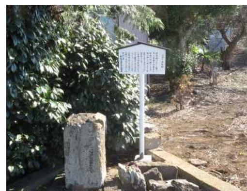
下川入六八一番地付近

道祖神は、外から襲い来る疫病や悪霊等を村境や辻、橋のたもとで防ぐ神として祀られている。正月十四日にはセイトバライが行われている。 この塔は、明和九年（1772年）十月に建立されたものである。 かつては、このとなりに男女の双体像が彫られた塔があったが風化し原形をとどめていない。