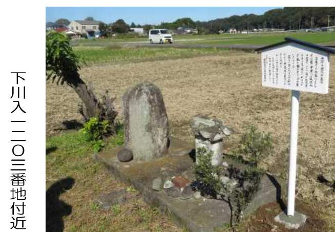
下川入二〇三番地付近

古きからの伝承「よんごし」その昔、中津川の大洪水のとき、この近くに高貴な方と見受けられる人が戸板に横たわって流れ着いたという。哀れに思った下川入の村人により供養塔が建立されたと伝わる。