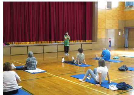
からだ健康体操講座