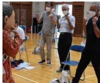
玉川公民館での様子

【日時】11月25日(金)午後1時30分~午後2時30分 【場所】睦合南公民館 2階集会室 【内容】トラビック(交通安全の歌に合わせたエアロビック) 【持ち物】飲み物(水分補給用)、汗拭きタオル 【服装】動きやすい服装 【講師】神奈川県警察交通安全教育隊、厚木警察署 【対象】市内在住60歳以上の方20人 【申込み】10月16日以降に睦合南公民館へ直接または電話(☎046-223-3774)でお申込みください。先着順。 【問合せ】交通安全課 ☎046-225-2760