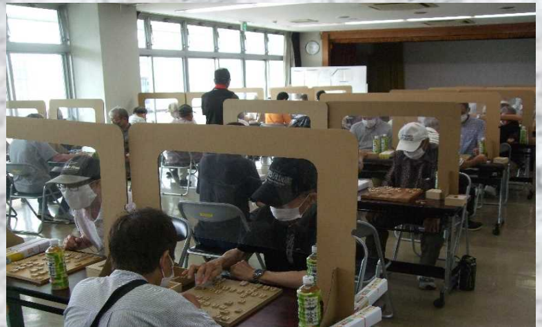
▲手に汗握る戦いが続きました!(前回大会の様子から)