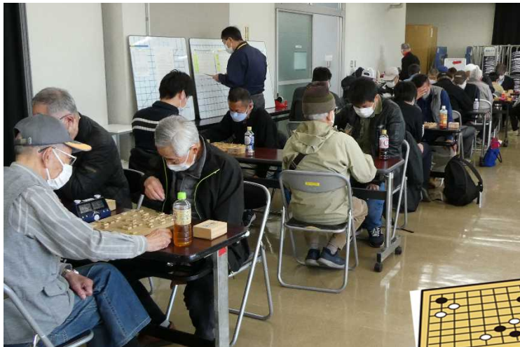
今回は、パーティーなしの開催となりました

3月19日(日)に行われました囲碁将棋大会は各クラスで熱戦が繰り広げられました。結果は次のとおりです。選手・役員の皆さん、お疲れさまでした！(敬称略)