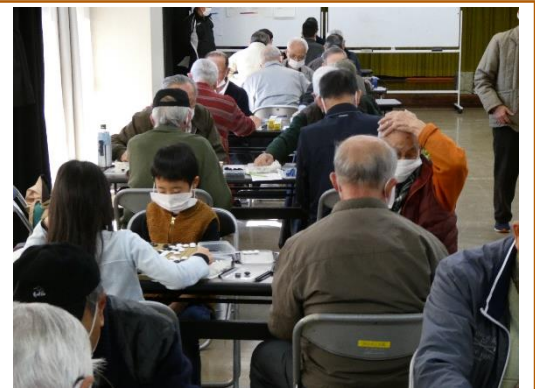
▲熱い対局再び! (前回大会の様子)