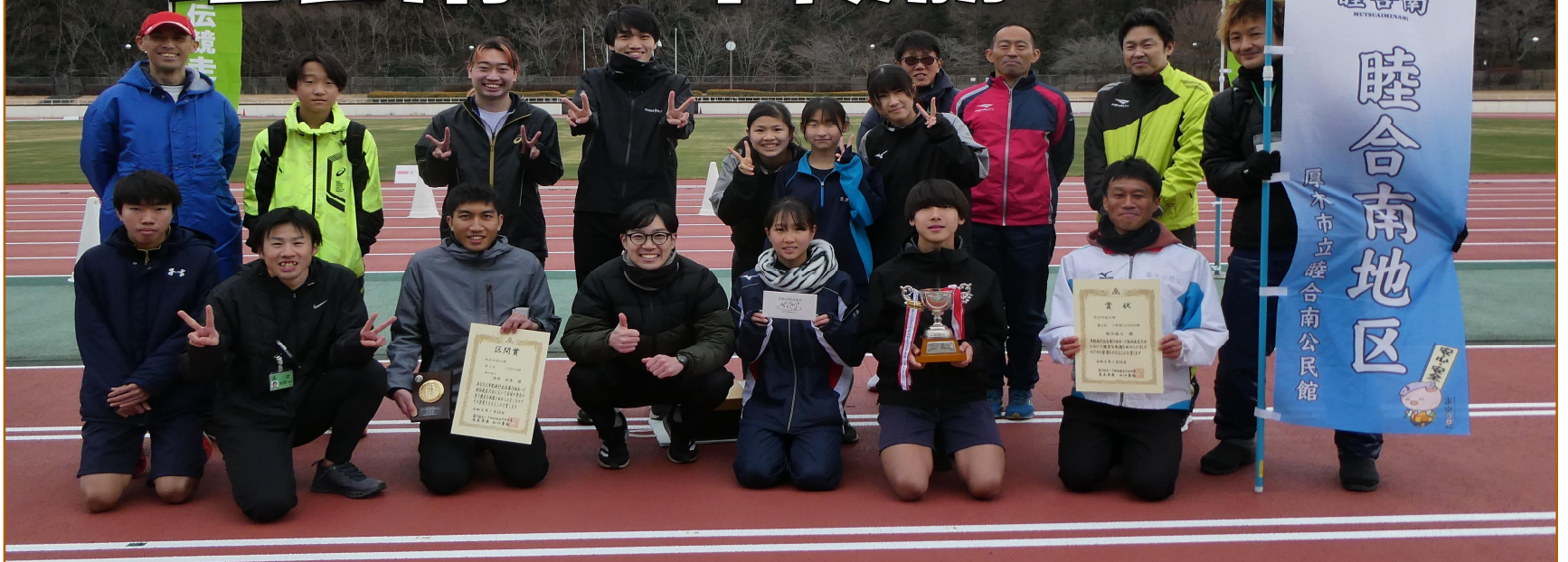
参加いただいた選手の皆様