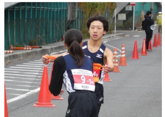
睦合南A第4区手水選手と第5区林選手のタスキリレー