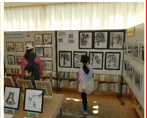
睦合東中の美術部&写真部の作品展示