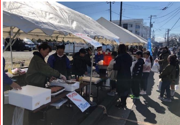
ふれあい広場も大盛況