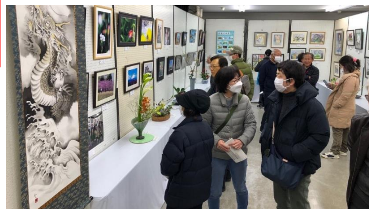
力作ぞろいの作品展示

5年ぶりのフルスペック開催で、作品展示に加え、土曜日はふれあいステージ、防犯研修会、日曜日は芸能発表会、ふれあい広場(模擬店など)、お楽しみ抽選会を実施し、約750人の皆様にご来場いただきました。