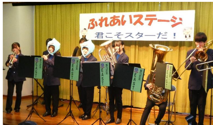
睦合東中吹奏楽部の楽しい演奏