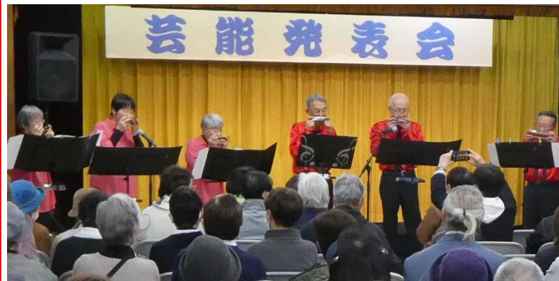
5年ぶりの芸能発表