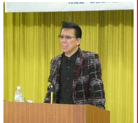
リーゼント刑事、来たる!!