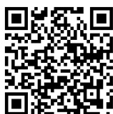
市 HP はこちら