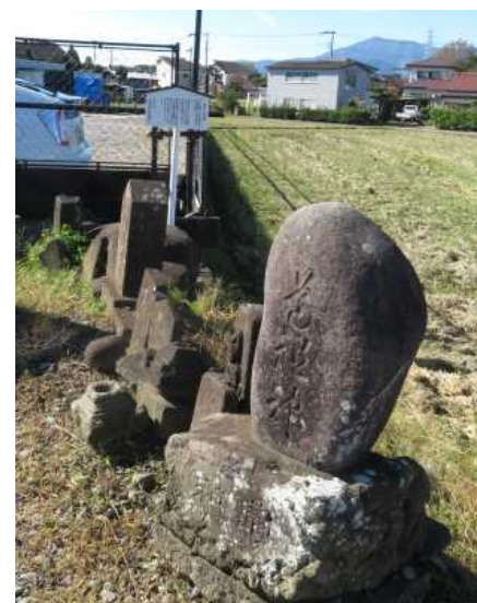
下川入一〇〇五番地付近

馬頭観音は、江戸時代中期以降、農民が農耕馬を持てるようになってからは、愛馬の供養塔として建立されるようになってきたと言われています。