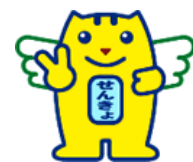
明るい選挙キャラクター 選挙のめいすいくん