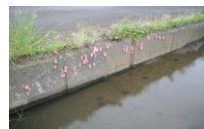
用水路に産み付けられたピンク色の卵塊