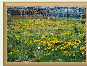
「黄色のジュータン」