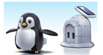
工作教室は「とことこペンギン」を作ります！