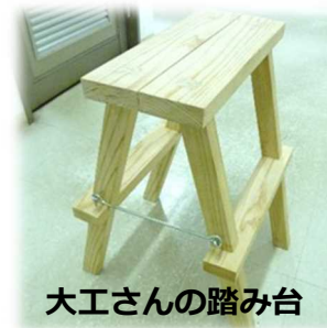
大工さんの踏み台