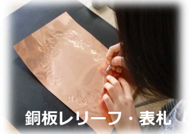
銅板レリーフ・表札