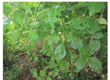
きれいな花が咲きますように！