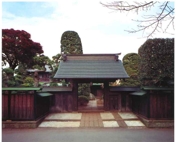
薬医門 棟札から明治19年(1886)に建築されたことがわかっています。