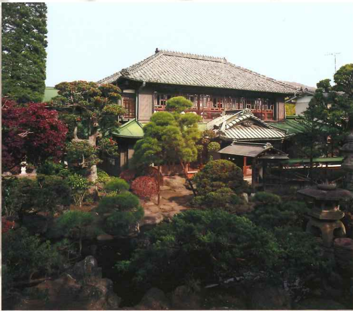
主屋 明治24年(1891年)建築