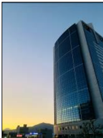
アクストメインタワー (岡田)