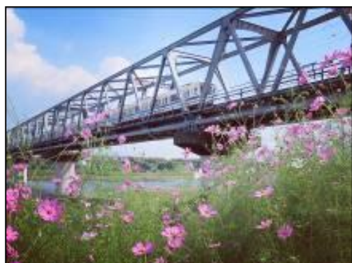
厚木側の小田急線 鉄橋下