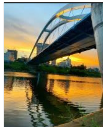
あゆみ橋下河川敷

特別展示「優しい旅びと・渡辺崋山」展—「厚木六勝」と「游相日記」—の連動企画として、9月1日から11月8日までに、InstagramやフェイスブックなどのSNSに「#厚木六勝」と付けてご投稿いただきました。