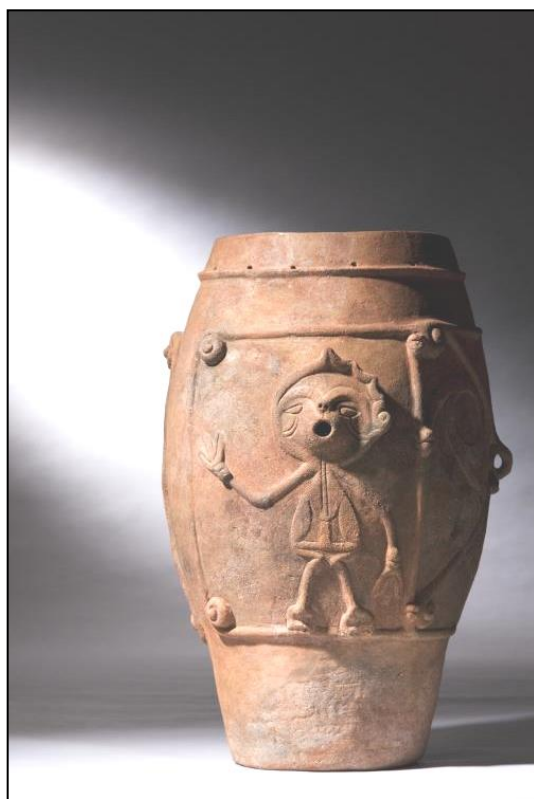
▲山梨県鋳物師屋遺跡出土 有孔罎付土器 (国指定重要文化財 南アルプス市教育委員会所蔵)

土器や土偶に見られる人体表現は抽象的ですが、縄文社会における共通するルールに則って表現されているように思われます。