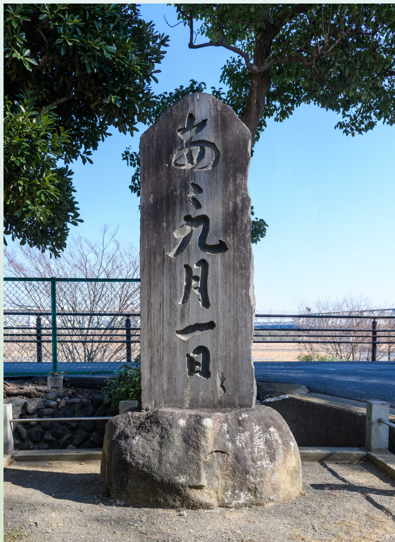
震災記念碑「あゝ九月一日」 厚木市厚木町

『厚木市史』初めての近代編です。 明治時代から大正時代までの資料を まとめました。