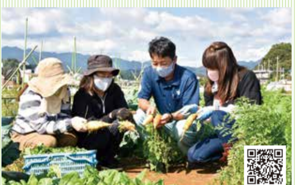
基礎コースで技術を学ぶ生徒たち

私たちが農業委員会は、関係機関、関係団体と手を携え、農業経営のより一層の向上のため、本年も取り組んでまいります。 新年が農業者をはじめ、市民の皆さまにとって、希望に満ち、健康で実り多き良い年となりますことを心よりご祈念申し上げます。年頭のあいさつといたします。