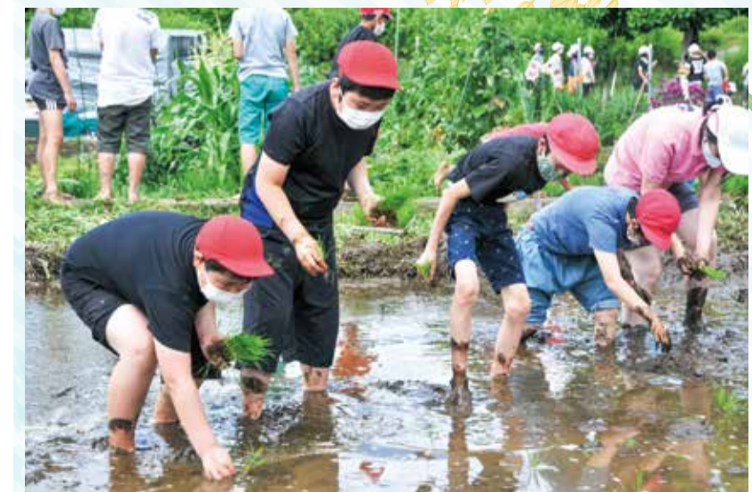
教えてもらったとおり苗を植えていく子どもたち