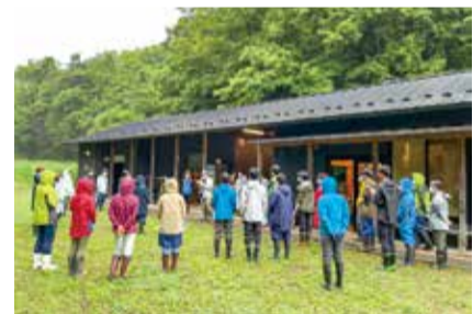
「あつぎこどもの森クラブ」のスタッフの説明を受ける学生たち