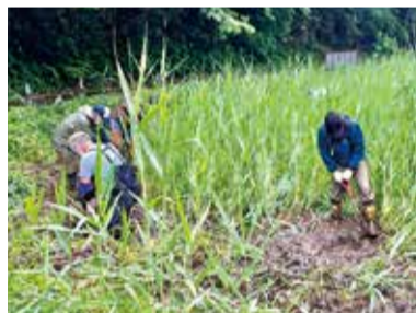
ヨシの抜根をする学生と「あつぎこどもの森クラブ」のスタッフ

生物多様性の保全と切り離せない環境が里地里山です。里地里山は、人間の働きかけによって、食料生産の場になるとともに、生物と共存する場にもなります。