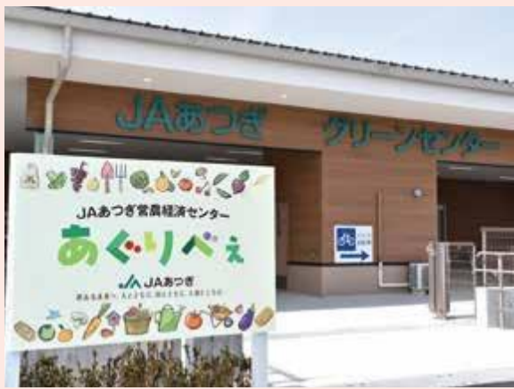
地域農業振興に向け新たに開設

J Aあつぎは5月、地域農業を支える新たな拠点として、営農経済センター「あぐりべえ」を、厚木市三田に開設しました。同施設には、「ライスセンター」と「グリーンセンター」を併設し、地域農業の情報発信基地として、管内農業に活力をもたらす施設を目指しています。