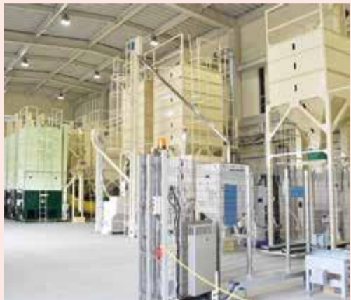
良質米生産へ各種機械を導入

J Aあつぎが設立してからの60年間、管内では著しい都市化が進み、農業を巡る環境は大きく変化しました。「都市農業」と呼ばれる現在の管内農業は、生産者と消費者の距離が近いという利点がある反面、さまざまな問題が生じています。特に米は、乾燥機の使用による騒音や粉じんの発生が避けられず、近隣への影響は長年にわ