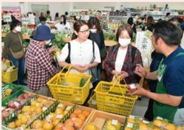
5月15日の開店日は多くの来店者でにぎわった

グリーンセンターは、地場農畜産物の販売と農業用生産資材などの取り扱いが一体となった店舗。生産者が丹精込めて育てた新鮮な野菜や果樹、肉、花きなどをはじめ、野菜苗や手作りの加工品が並び、幅広のニーズに対応した生産資材を取りそろえています。新設した「営農相談窓口」では、知識豊富な営農技術顧問や店舗職員が、農業に関するさまざまな疑問の解決をサポートします。