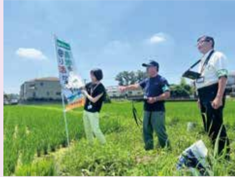
職員とともにパトロールをする様子

農地パトロール実施中 農地の利用状況を把握するため、年4回、各地区担当の農地利用最適化推進委員が中心となって農地パトロールを実施しています。 農業委員と推進委員が農地を巡回していますので、ご理解、ご協力をいただくとともに、農地や農業に関する相談などがありましたらお声がけください。