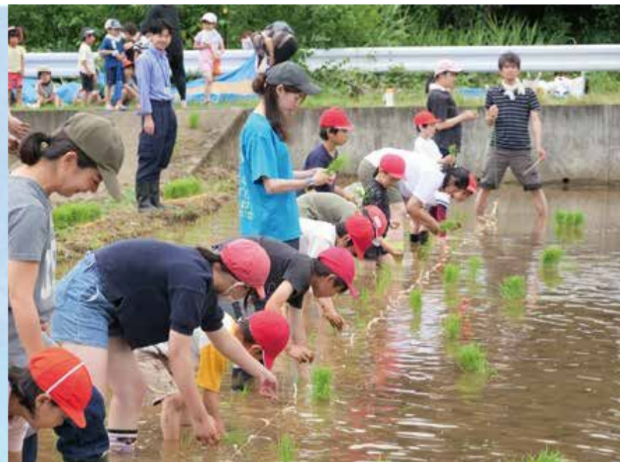
泥の感触を楽しみながら苗を植える子どもたち

当日は校長先生が、手順を丁寧に説明し、その後、子どもたちが、実際に作業を行いました。機械を使わない昔ながらの方法で、田んぼに張られたひもを目印