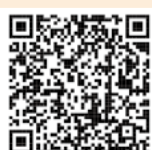
市ホームページ 二次元コード