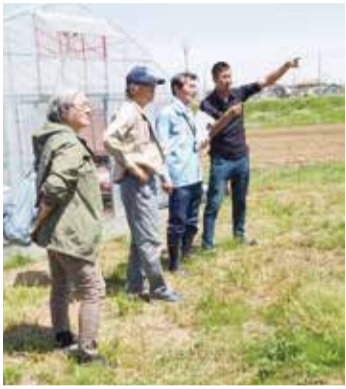
作付け状況を確認

近年は、農業者の高齢化や後継者不足に伴う耕作放棄地の増加が全国的な課題となっており、本市においても、新規就農者の確保・育成が重要となっています。今後も引き続き、関係機関と協力・連携し、課題解決に取り組んでまいります。