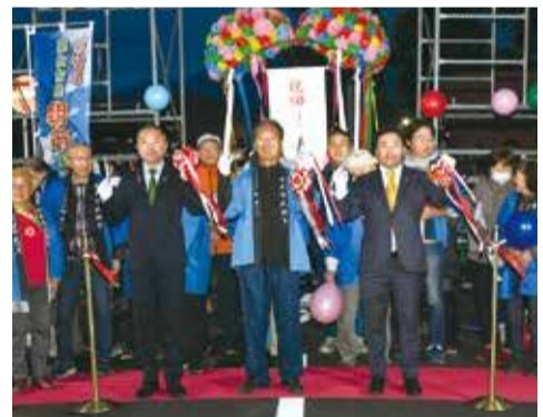
開設50周年式典の様子