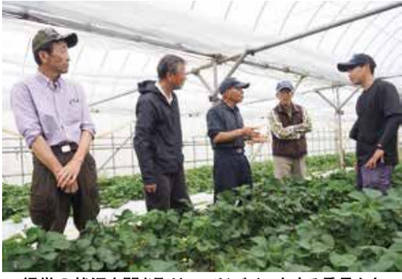
経営の状況を聞き取り、アドバイスをする委員たち

は気軽に声掛けできる」「就農して利益を出していくのは本当に変なこと、多くの人の支援が不可欠」「効率化のため、農地の集約化を支援していきたい」などと、支援の必要性を実感していました。