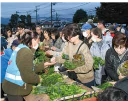
多くのお客様でにぎわう朝市

そして、朝市の最大の魅力は、出店者との会話を楽しみながら買い物ができることです。早朝からお目当ての品物を求め、多くの来場者で会場がにぎわうと、出店者とお客様の楽しそうな会話が飛び交います。その風景は、今ではすっかり厚木の日曜早朝の風物詩