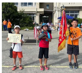
優勝だ！南町自治会

10月5日（日）は絶好の運動会日和に恵まれ、各地区から多くの皆さんに参加いただき盛大に運動会を終了することができました。選手の皆さんを始め、準備から携わっていただいた役員、自治会の皆様ありがとうございました。