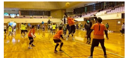
▲ソフトバレーの試合の様子