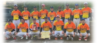
▲ソフトボールチームの皆さん

各競技の監督、選手並びに体育振興会会員の皆様、そして応援して下さった皆様、大変ありがとうございました。