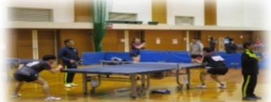
▲卓球の試合の様子