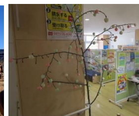
▲だんごの木の展示