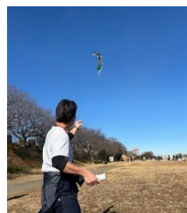
▲連だこあげの様子▲

当日の運営等にご協力いただきました、コミュニティづくり事業推進委員会の皆さま、自治会長の皆さま、消防団の皆さま、交通安全指導員の皆さまには、早朝からお手伝いいただき本当にありがとうございました。