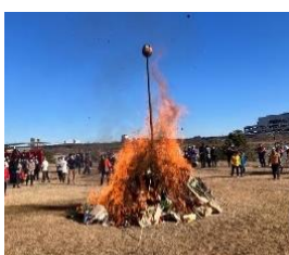
▲お焚き上げの様子