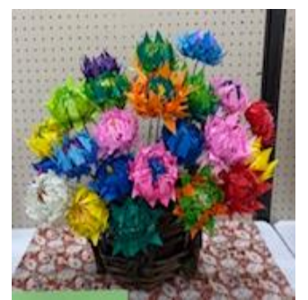
多芸多才な皆さんの出演で盛り上がった芸能発表会