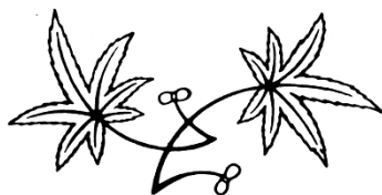
市の木 もみじ —Japanese maple—