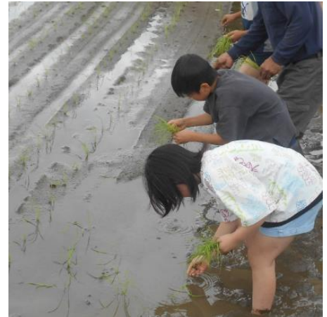
地域の方のご指導で苗を植える児童

田植えが終わった後、水路で泥を洗い流して田んぼを見ると、苗がきれいに並んで風に揺れています。田植えを終えた児童たちはみんな笑顔で、やり切った達成感であふれていました。これから収穫まで、地域の方々のお力を借りながら、おいしいお米ができるよう、みんなで力を合わせてお世話をしていきます。