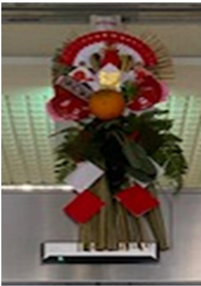
昨年作品です。公民館の玄関に飾りました。