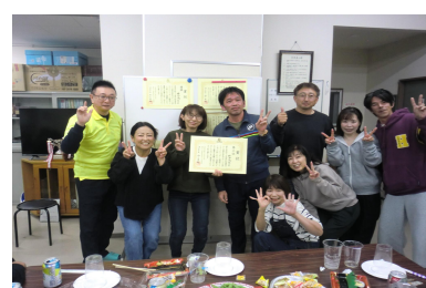
ソフトバレー 【トリム40】