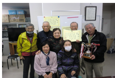
グラウンド・ゴルフ 【睦合北B】