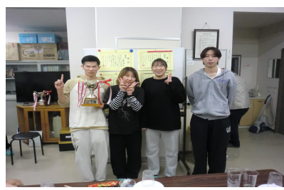
ソフトバレー 【フリーの部】