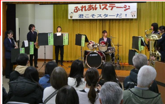
睦合東中学校吹奏楽部の楽しい演奏

春の陽気の中での開催で、作品展示に加え、土曜日はふれあいステージ、吹奏楽コンサート、日曜日は芸能発表会、ふれあい広場(模擬店など)、お楽しみ抽選会を実施し、多くの皆様にご来場いただきました。