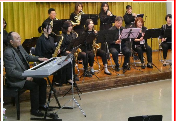
Symphonic Do による吹奏楽コンサート