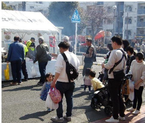
ふれあい広場也大盛況