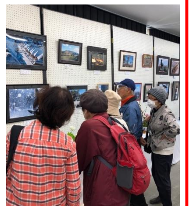
力作ぞろいの作品展示