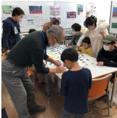
切り絵体験コーナー