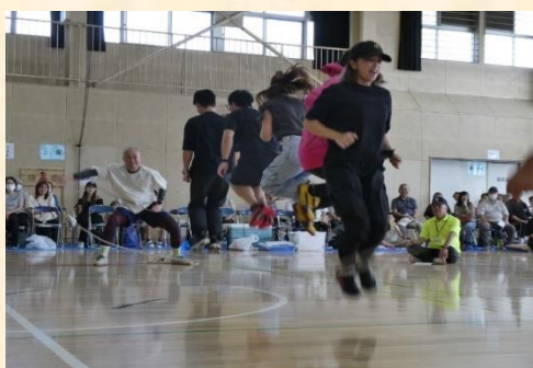
みんなでジャンプ

「みんなでジャンプ (長縄跳び)」、「玉入れ」や「綱引き」、といったお馴染みのプログラムのほか、スリッパ飛ばしなどを実施し、子どもから高齢者まで楽しめる内容となりました。また、自治会ごとの対戦で行った綱引きは、選手と応援者との距離が近く、各自治会がより一体となった熱い競技となり、大変盛り上がりしました。参加された選手の皆さん、従事された役員や睦合東中学校ボランティア生徒の皆さん、大変お疲れ様でした！