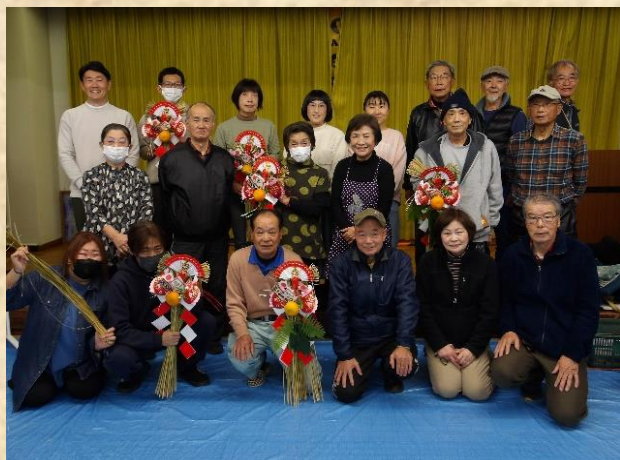
(講師と受講者の皆さんで記念写真)

12月23日に学級講座(しめ飾り教室)を開講しました。 皆さん3時間以上をかけて、手作りならではの温かみのある、しめ飾りを作成しました。 受講者からは「自分で作ったしめ飾りで新年を迎えるのは格別な気分です」「来年も参加したいです」などの声があがりました。