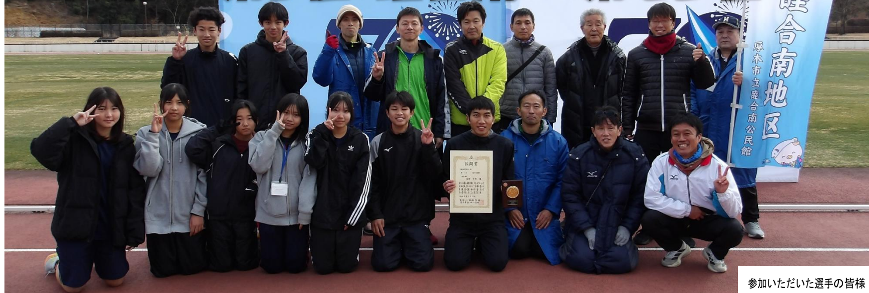
参加いただいた選手の皆様