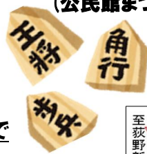
(公民館まつり大会の様子)