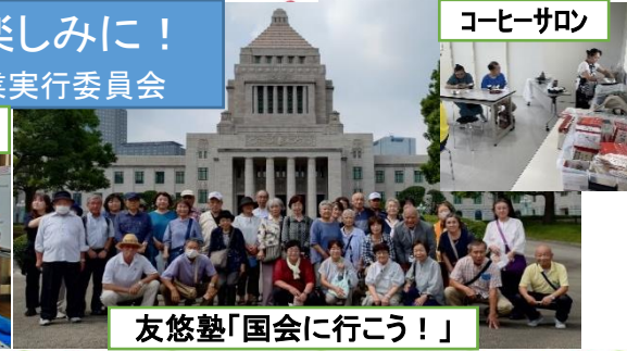
友悠塾「国会に行こう！」