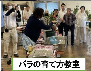
バラの育て方教室