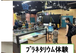
プラネタリウム体験