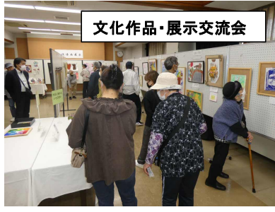
文化作品・展示交流会