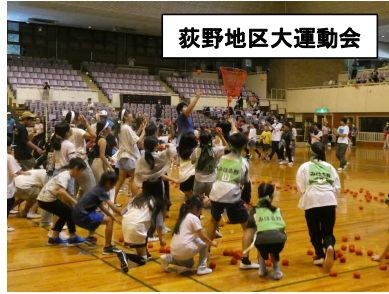
荻野地区大運動会