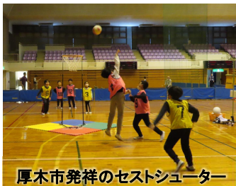
厚木市発祥のセストシューター

《その他》 出入り自由です。運動のできる服装で、室内履きを持参してください。雨天の場合は、屋外競技(多目的広場)は中止です。