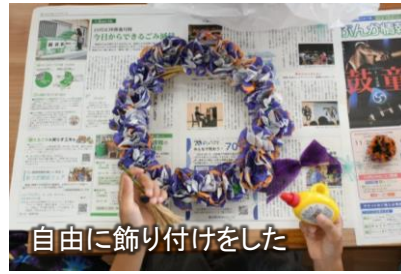
自由に飾り付けをした

10月18日(土)に、上荻野小学校区地域子ども教室の取り組みとして、まつかけ台児童館で「ハロウィンのリース作り