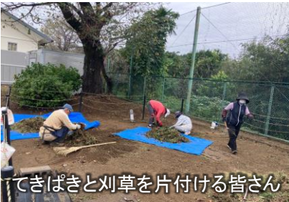
てきぱきと刈草を片付ける皆さん

10月14日(火)、荻野地区シルバー人材センター会員の皆さんに、上荻野分館の草刈りをさせていただきました。ありがとうございました。