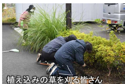
植え込みの草を刈る皆さん