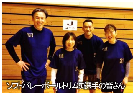
ソフトバレーボールトリム50選手の皆さん