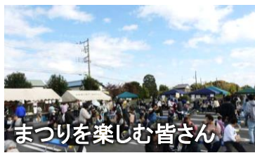
まつりを楽しむ皆さん