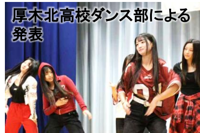
厚木北高校ダンス部による 発表