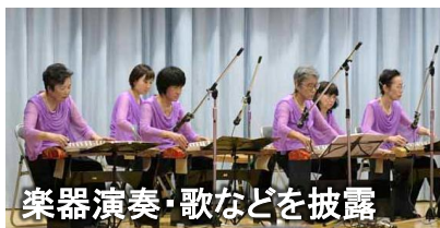
楽器演奏・歌などを披露