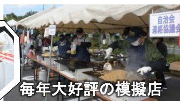
毎年大好評の模擬店