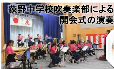
荻野中学校吹奏楽部による 開会式の演奏

16日は、荻野中学校吹奏楽部による演奏でスタート。芸能発表は12組が、歌や楽器演奏、踊りなどを披露しました。模擬店は、出来たての焼きそばや焼き鳥などを求める皆さんでにぎわい、笑顔があふれていました。参加した皆さん、協力いただいた役員・自治会の皆さん、ありがとうございました。