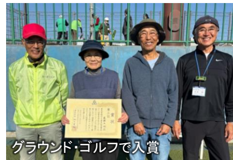
グラウンド・ゴルフで入賞

11月30日(日)に地区対抗のスポーツ大会が開催され、荻野地区はソフトボール、ソフトバレーボール、バドミントン、卓球、ターゲット・バードゴルフ、グラウンド・ゴルフ、モルックに出場し、ソフトバレーボールトリム50の部とグラウンド・ゴルフで3位を獲得しました。選手の皆さん、スポーツ振興会の皆さん、お疲れさまでした。