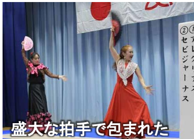
盛大な拍手で包まれた