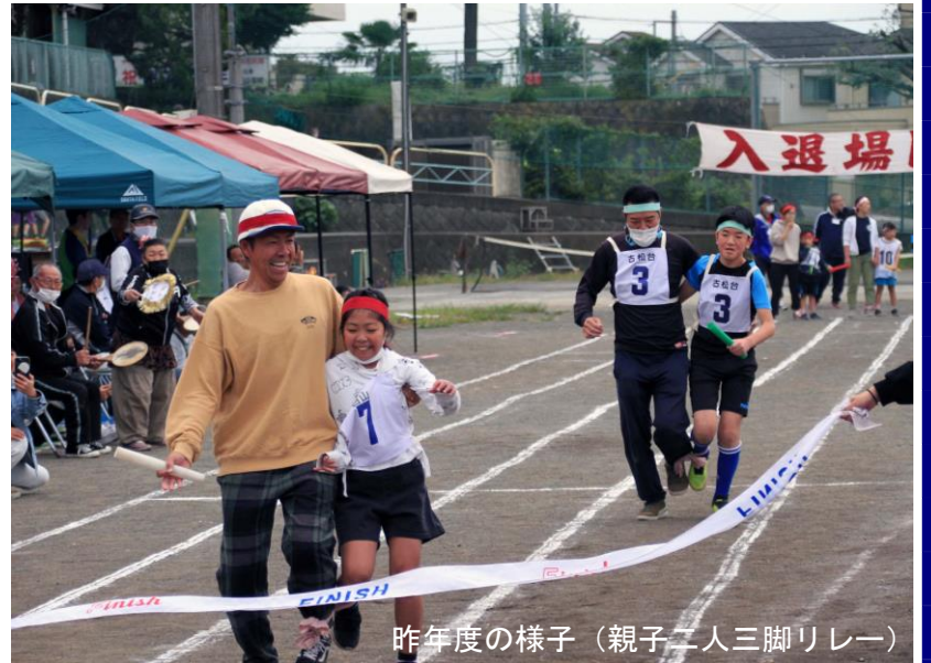
昨年度の様子(親子二人三脚リレー)