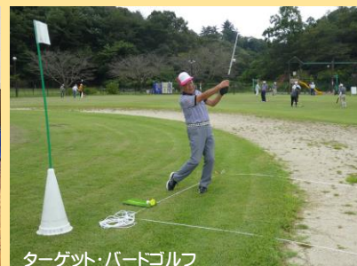
ターゲット・バードゴルフ