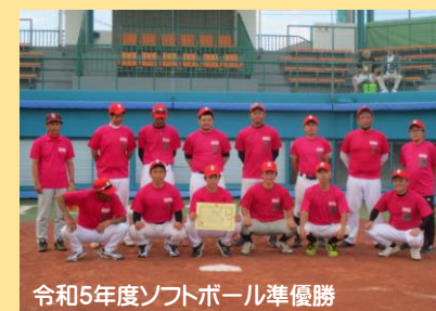
令和5年度ソフトボール準優勝