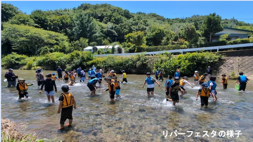
リバーフェスタの様子