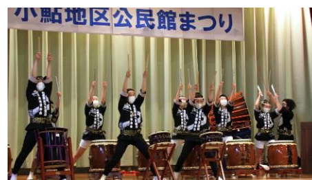
公民館まつり (芸能発表)