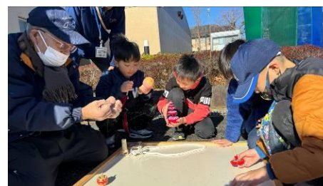
新春お楽しみ会 (昔遊び)