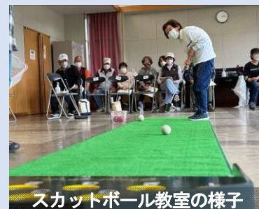
スカットボール教室の様子