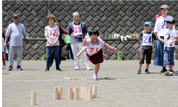
▲春季健康まつり (スポーツ振興会事業)