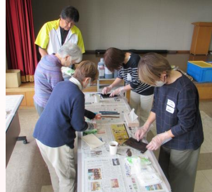
▲レーザークラフト教室 (学級・講座事業)