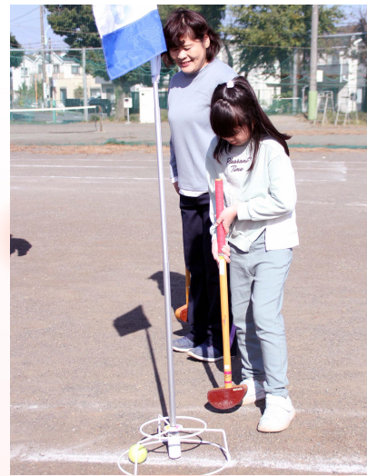
▲秋季健康まつり (コミュニティ振興会事業)