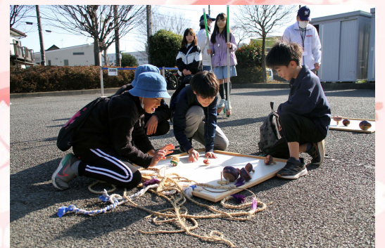
▲新春おたのしみ会 (文化振興会事業)