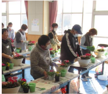
▲寄せ植え教室 (学級・講座事業)