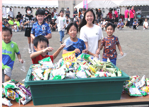
▲運動会 (スポーツ振興会事業)