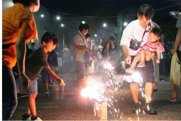
▲小さな花火大会 (コミュニティ振興会事業)