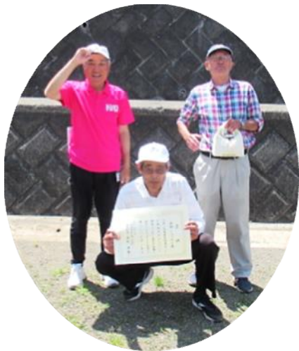
▲優勝チーム：ハイデンス2組