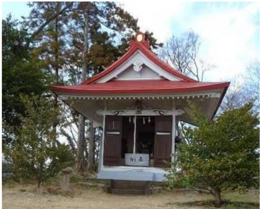
▲小町姫を祭る山頂にある小町神社

発行元/厚木市立玉川公民館 〒243-0121 厚木市七沢 175-6 ☎(046) 248-0006 FAX(046) 270-2300 メールアドレス 8619@city.atsugi.kanagawa.jp