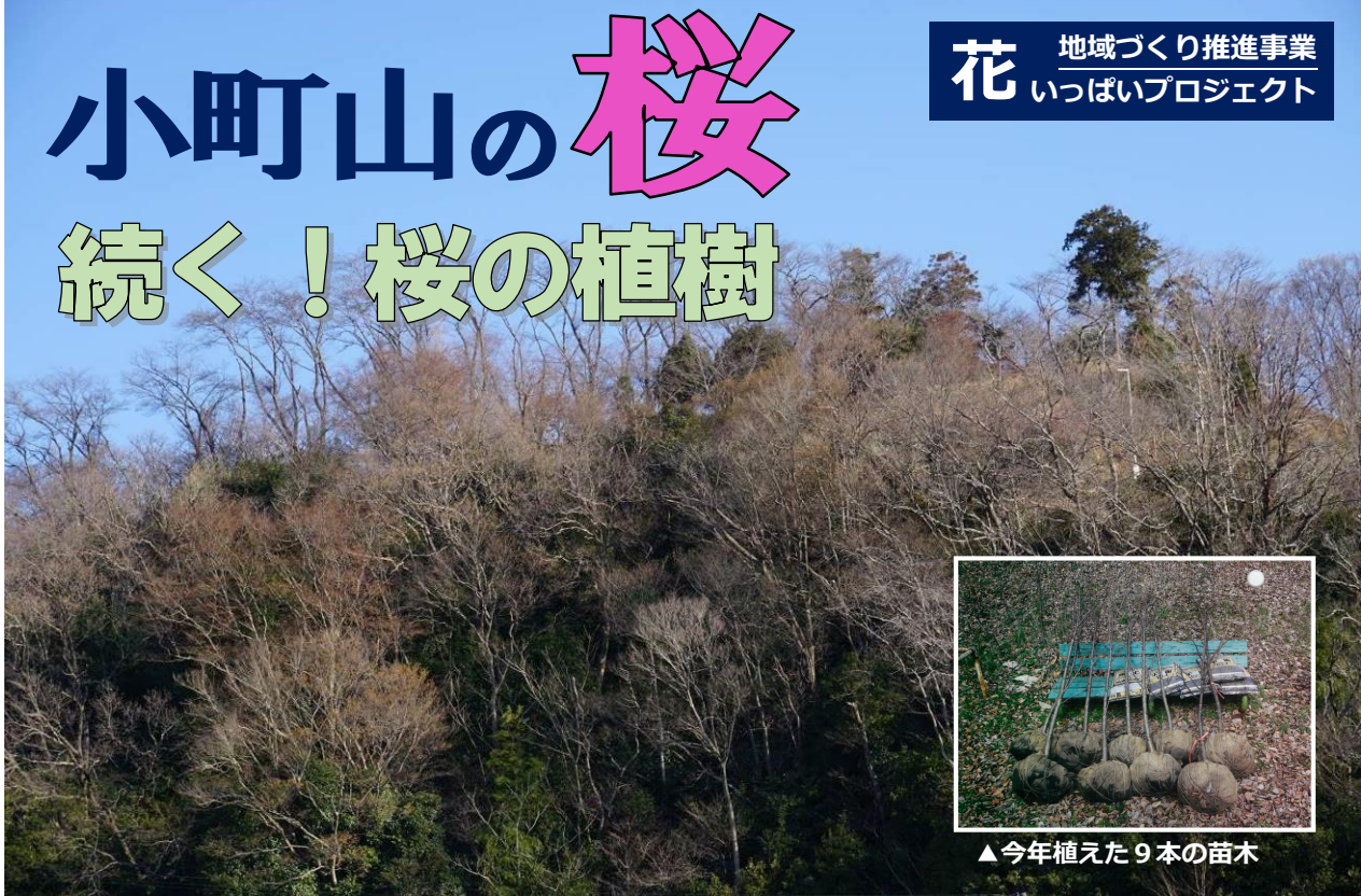
▲玉川地域で桜の名所の一つ小町山山頂を小野橋付近から望む(3月16日撮影)