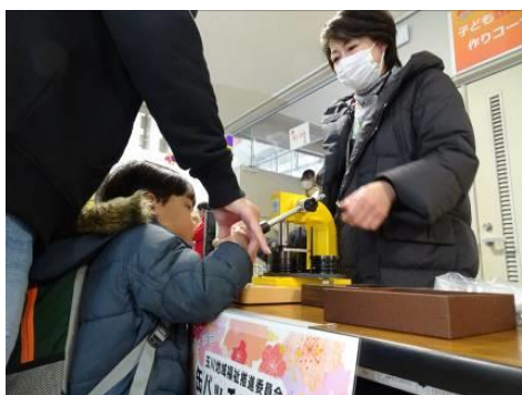
▲子供たちに人気だった缶バッジコーナー