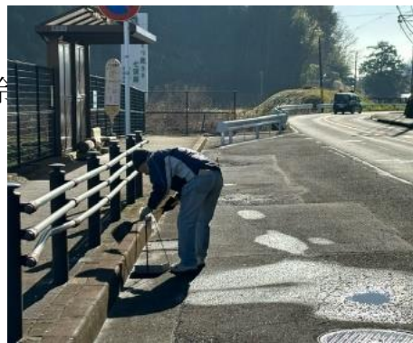
▼バス停を折々にきれいに掃き清める