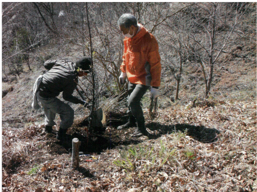
▲桜の苗木を植える小町里山の会メンバー