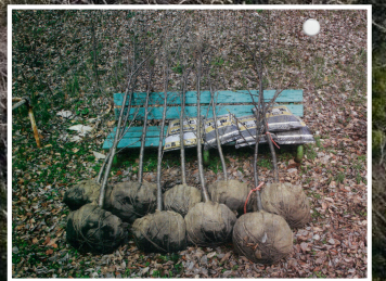
▲今年植えた9本の苗木

小町山の山頂にある小町神社の桜は玉川地域の桜の名所の一つ。地域の皆さんには馴染み深い桜です。山頂には「小町山桜植樹記念碑」があり昭和53年3月吉日と刻まれています。今から46年前、地域を挙げて桜を植えて、名所となったに違いありません。毎年、満開の桜見物は地域の風物詩となっています。