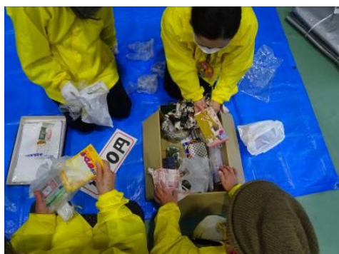
▲盛況だったバザーの集計作業